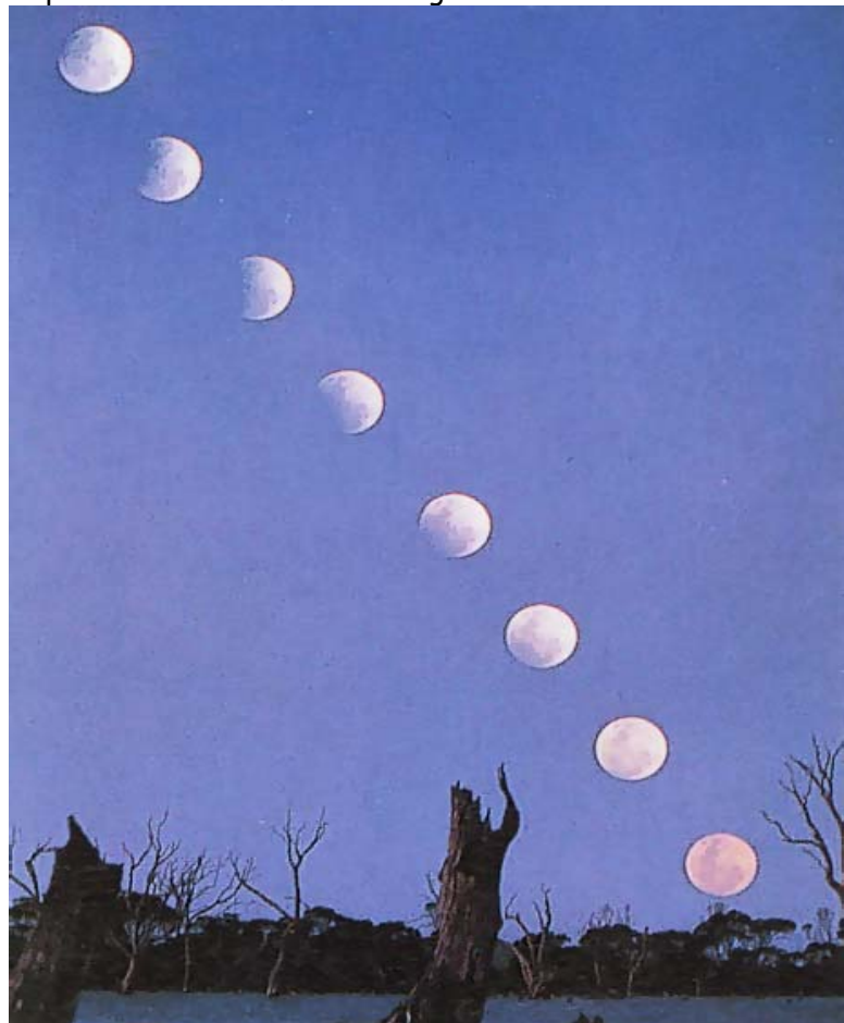
Questa fotografia, tratta dal libro "Il Cielo" di David H. Levy, edizioni DeAgostini, è stata eseguita con pose di 1/60 di secondo ogni 20 minuti e mostra un'eclissi parziale di Luna.